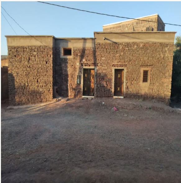
مستوصف أبادو المحدث سنة ١٩٣٢ بقبيلة غجدامة. (عمل ميداني بتاريخ ١٥ غشت ٢٠٢١)