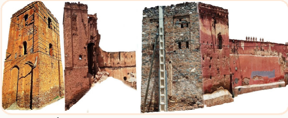
جانب من أبراج الجهة الجنوبية للقصة جانب من الواجهة الشرقية للقصة